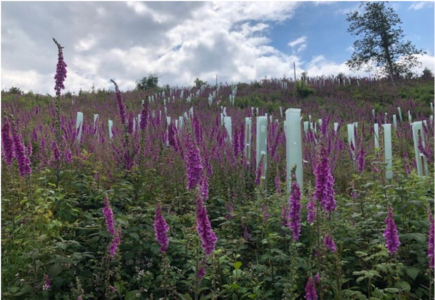
An der Talsperre

Dort wo Kyrill alle Bäume flachlegte, hat der Fingerhut die Fläche erobert